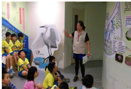
聚精會神聽高蹺鶴的故事