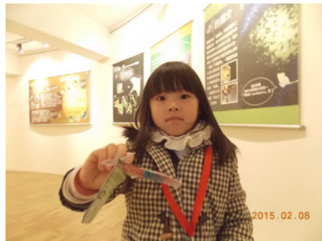
慕光之城—台灣蛾類多樣性特展