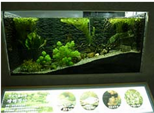
2樓魚缸展示區-埤塘濕地