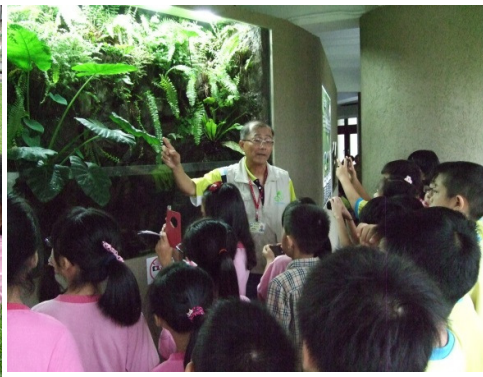
大家踴躍發表看法