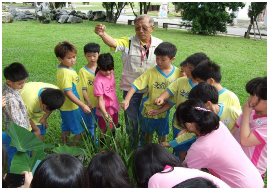
藉由志工爺爺瞭解濕地植物