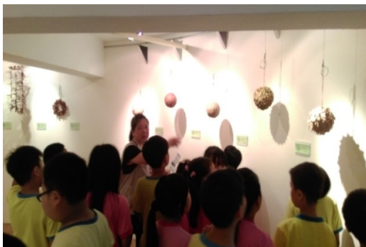
植物的葉子、種子及果實千奇百怪