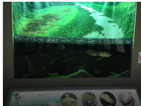
2樓魚缸展示區-濕地的隱憂