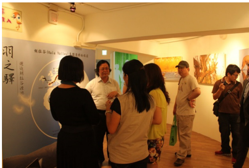
羽之驛邂逅胡拉谷特展