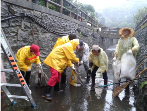
樹林中山里鹿角溪淨溪活動