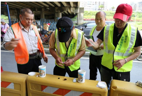
中和秀景里水環境巡守隊—水質監測包操作教學