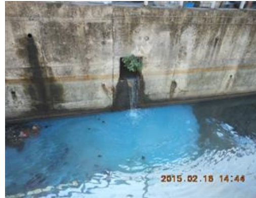
樹林—後村圳水污染