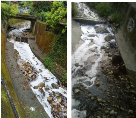
五股溼地—大窠溪水污染