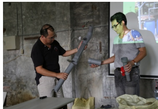
鸚哥水環境巡守隊—水撲滿實做教學