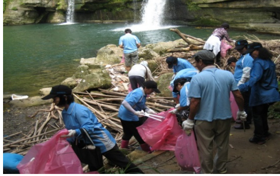
平溪—嶺腳瀑布淨溪