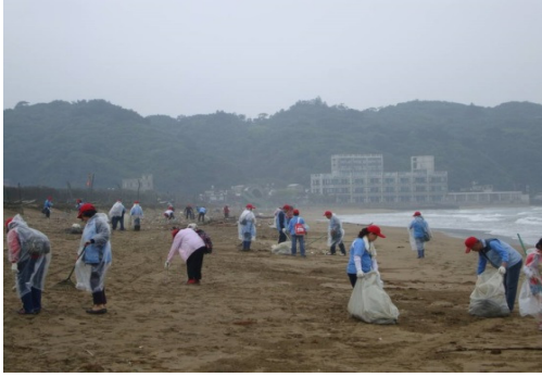
萬里漁港—加投下寮淨灘