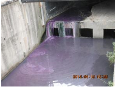
新莊—後村圳水污染