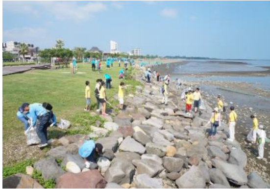
新北市水環境巡守隊八里聯合淨灘