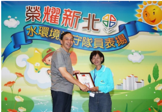
榮耀新北、巡守隊經驗分享暨感恩活動