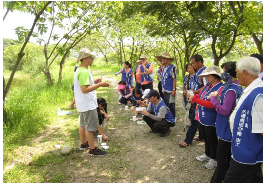
新竹縣水環境巡守隊參訪鹿角溪溼地