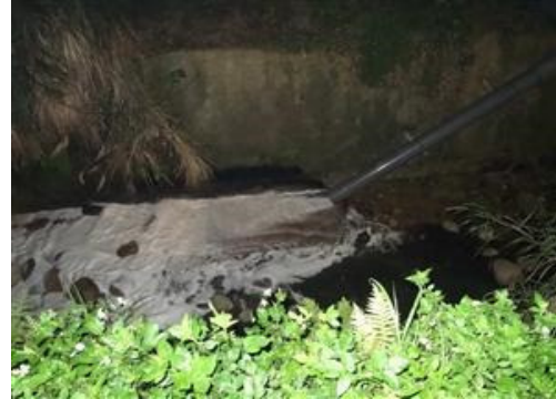
五股濕地—水碓窠溪